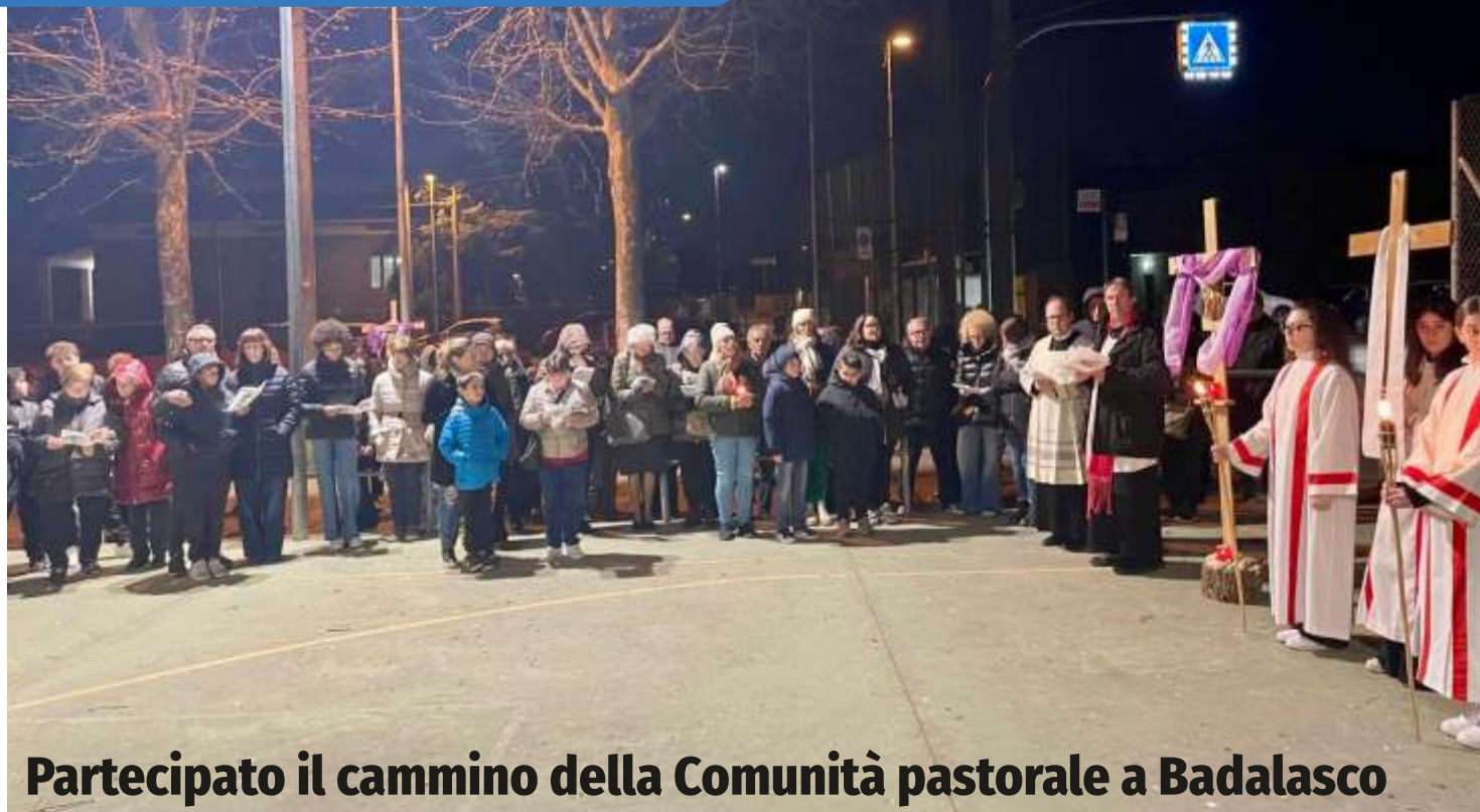
Partecipato il cammino della Comunità pastorale a Badalasco