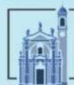
Fara Gera d'Adda